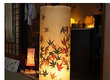
名尾和紙による行灯